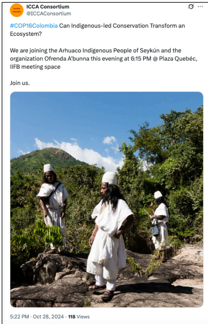
Figura 1. Comunidad Seykún en la CBD COP16.

territorio actualmente ” (Entrevista 5). Según los Entrevistados en consenso, el establecimiento de acciones de conservación en el territorio Seykún tiene mayores retos que los que encuentran comunidades arhuacas en la parte alta de la SNSM. La comunidad está ubicada en una zona con mucho más contacto con el mundo no-Indígena, tienen interacción con actores muy diversos (campesinos, terratenientes, grupos armados ilegales, grupos empresariales, entre otros); se encuentran en una zona más transformada y con mayores presiones que en territorios de la parte alta de la sierra.